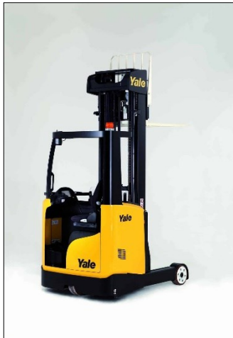
Pilt 1. Yale lükandmastiga

Asutuses on kasutusel pildil 1 kujutatud tõstuk.